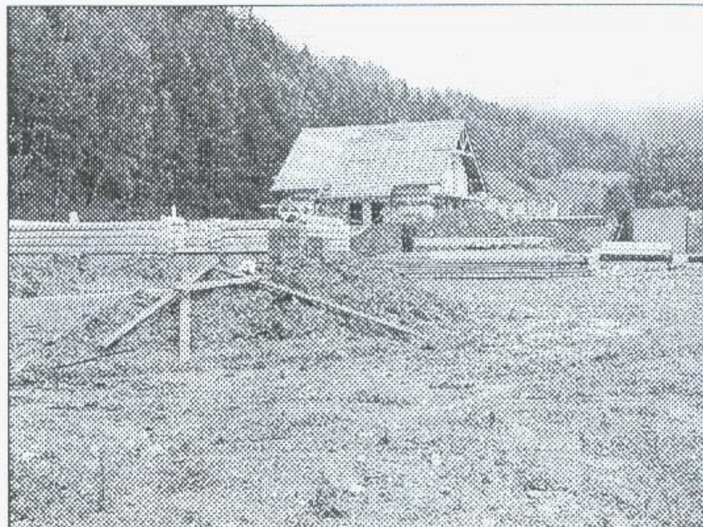
Výstavba rodinných domov v lokalite Pod Žiarom

V mesiaci júni 2007 sa uskutočnila v lokalite Pod Žiarom kolaudácia inžinierskych sietí (vodovodu, dažďovej kanalizácie) a celkovej úpravy terénu. Časť prác na vybudovaní inžinierskych sietí bola financovaná z rozpočtu obce s príspevom nových vlastníkov pozemkov a správcov inžinierskych sietí. V tomto toku obec ako stavebný úrad vydala 9 stavebných povolení na výstavbu rodinných domov v tejto lokalite. Teší ma, že v súčasnosti už noví majitelia stavebných pozemkov začali s výstavbou rodinných domov.