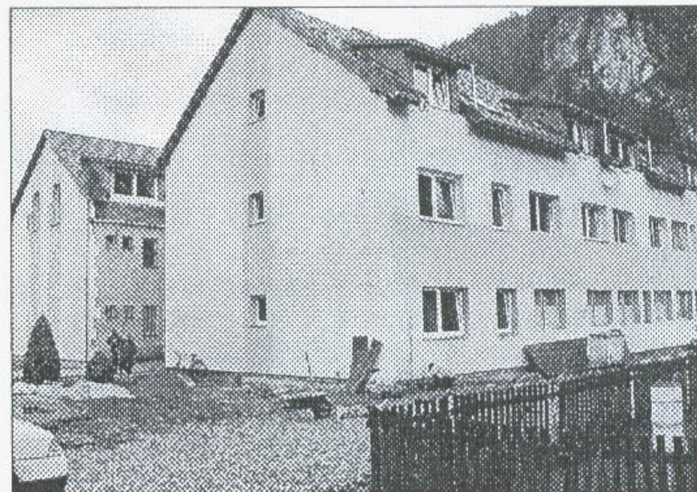
Obr. 1: Zdravotné stredisko pred začatím výstavby v júni 2006 Obr.2: Zdravotné stredisko pred kolaudáciou v septembri 2007

Rozčlenením celého pozemku vzniklo v lokalite 12 parciel, z ktorých budú tri využité na stavebné účely.