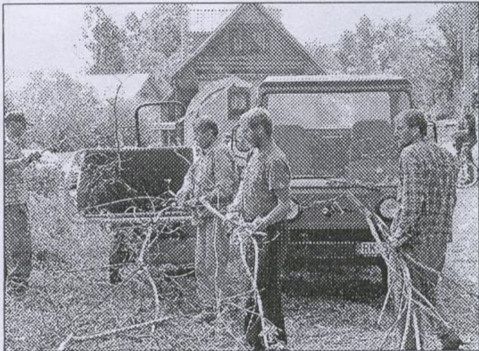
Obr. 4: Pracovníci aktivačnej činnosti počas výroby drevných štiepok

Aj v tomto roku obec zamestnáva občanov v rámci projektu aktivačnej činnosti, ktorá je financovaná z Európskeho sociálneho fondu. Do projektu je v našej obci zapojených 14 nezamestnaných občanov a jeden koordinátor. Náplňou ich práce je údržba verejných priestorov a majetku obce. Práce vykonávajú 2-krát týždenne po 5 hodín. Platnosť zmluvy s Úradom práce a sociálnych vecí a rodiny o financovaní aktivačnej činnosti je do 30.11.2007.